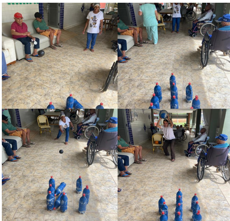
Atividade motora “boliche” - janeiro de 2023