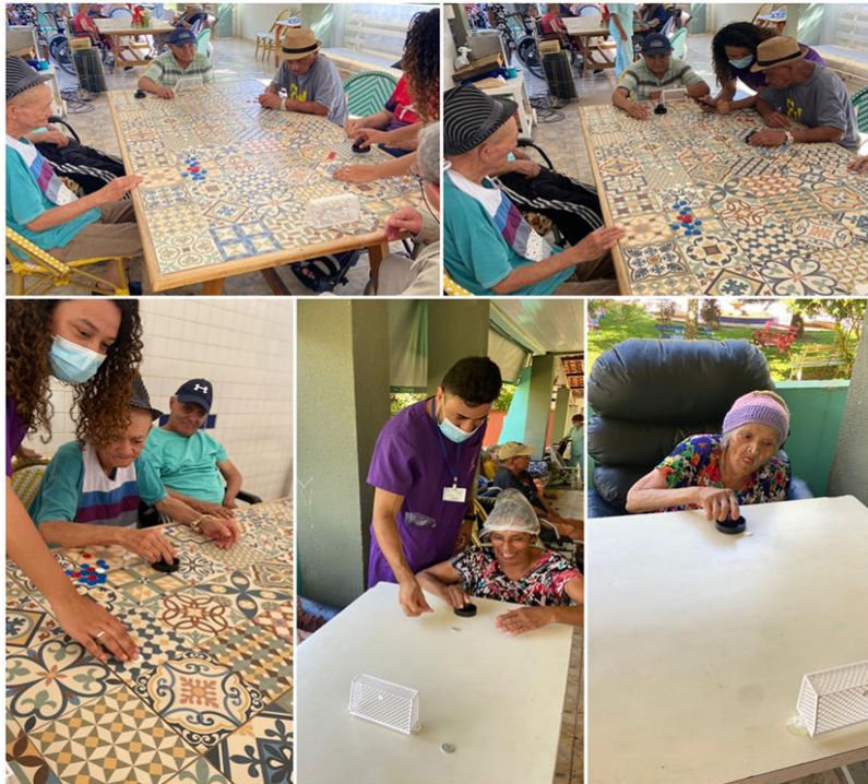
Atividade “ futebol de botões “ - Fevereiro de 2023

SMPW Trecho 3 Área Especial nº. 01 e 02 – Park Way – Brasília-DF - CEP: 71.735.090 – Fones: (61)3552-0504/ (61)993520912 CNPJ. 00.065.060/0001-92 – SITE: www.institutointegridade.org.br - E-mail: lymm.sec1@gmail.com