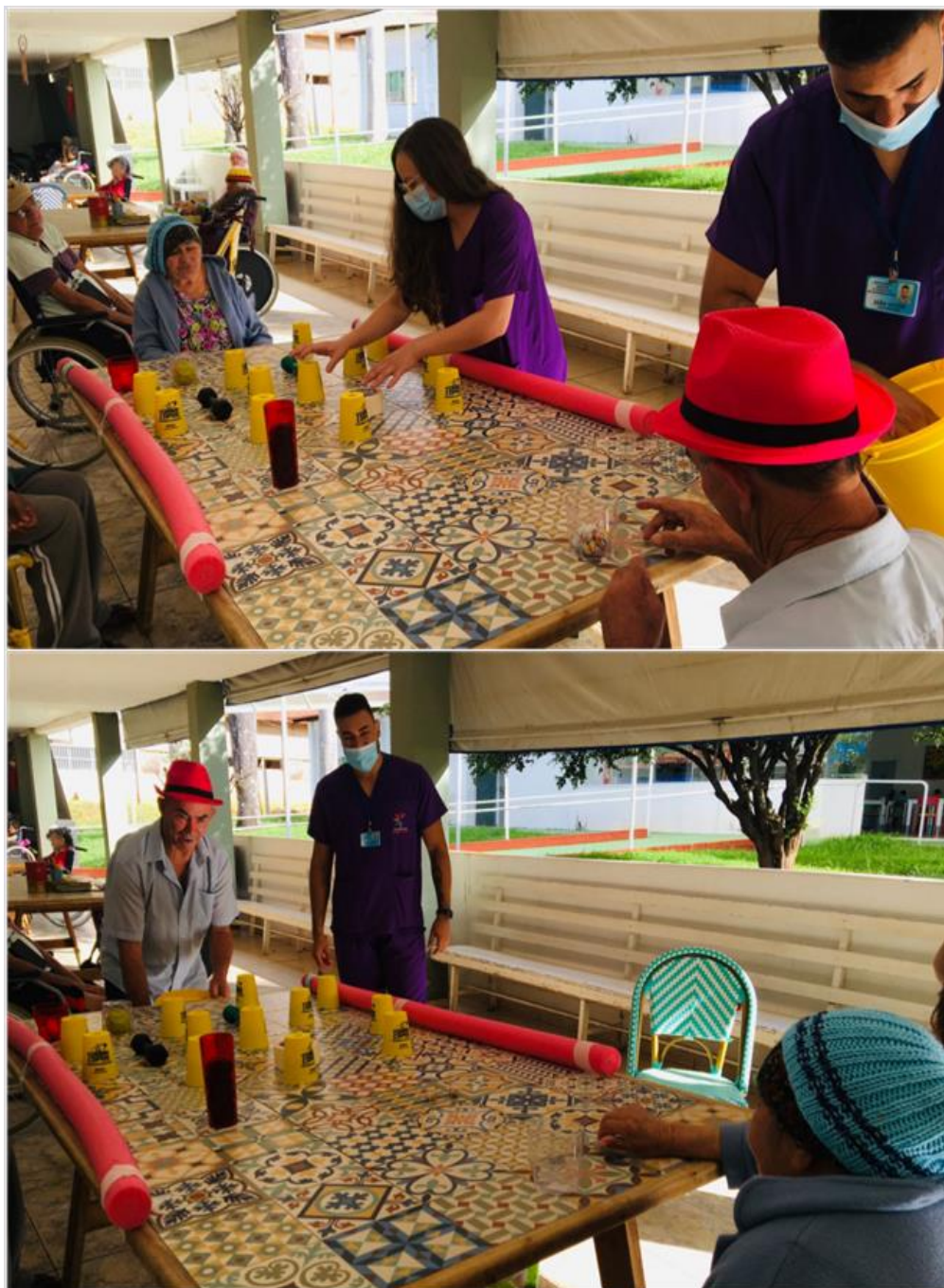
Atividade “Pinball da terceira idade “ Abril de 2023

SMPW Trecho 3 Área Especial nº. 01 e 02 – Park Way – Brasília-DF - CEP: 71.735.090 – Fones: (61)3552-0504/ (61)993520912 CNPJ. 00.065.060/0001-92 – SITE: www.institutointegridade.org.br - E-mail: lvmm.sec1@gmail.com