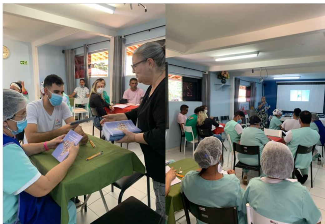
Palestra da gerência de apoio à saúde da família para os cuidadores - 07 de junho de 2023