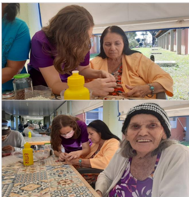
Atividade Bijuterias - junho de 2023