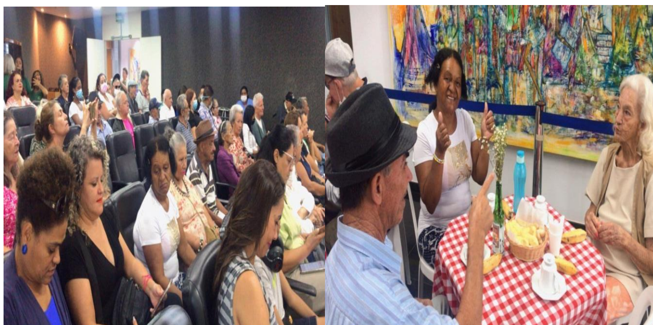
Atividade externa - passeio a Biblioteca Nacional de Brasília - ” Chá Literário - Cirandas e Histórias na Terra de Memórias -Março de 2023