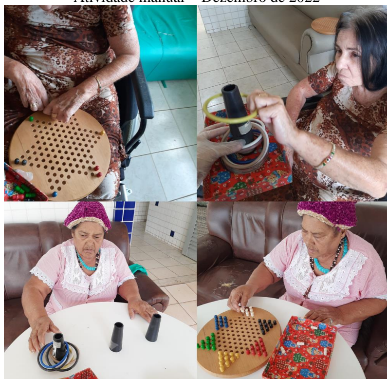
Atendimentos individuais - atividade e exercícios manuais - Dezembro de 2022