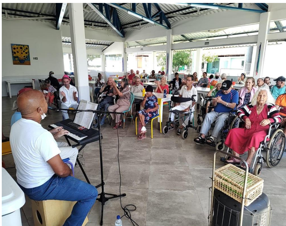
Prática Religiosa - Março de 2023