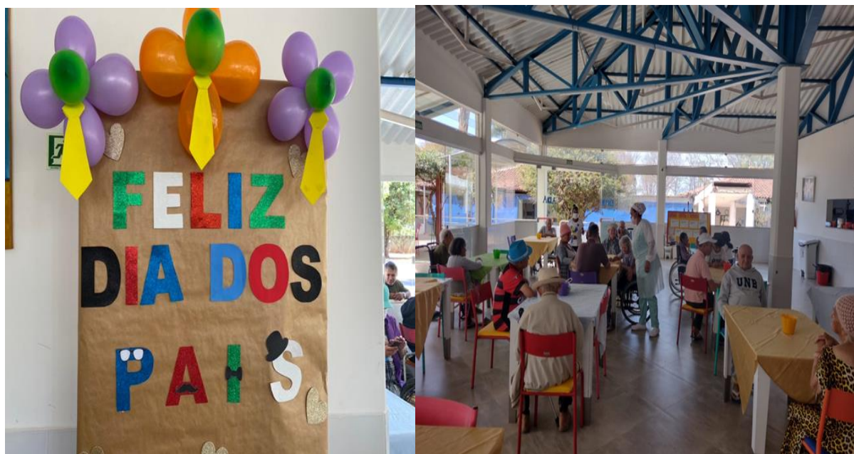
Comemoração dia dos pais - agosto de 2023