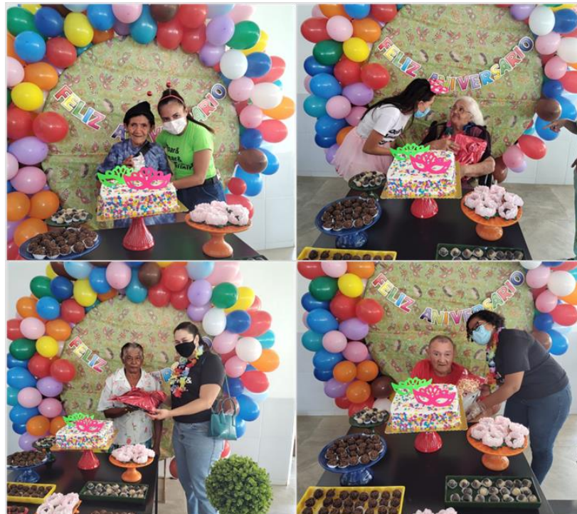
Festa dos aniversariantes - Fevereiro de 2023