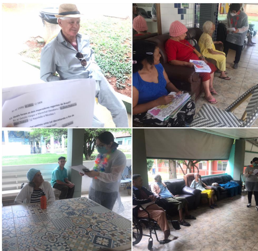
Atividade Quiz - 07 de novembro de 2022