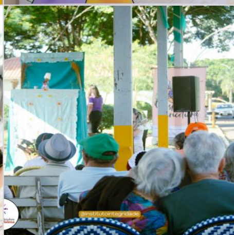
Apresentação Teatral - “ O despertar da Maricotinha” - Maio de 2023