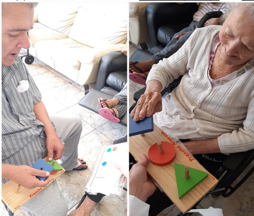
Atendimento da terapia ocupacional - agosto de 2022

SMPW Trecho 3 Área Especial nº. 01 e 02 – Park Way – Brasília-DF - CEP: 71.735.090 – Fones: (61)3552-0504/ (61)993520912 CNPJ. 00.065.060/0001-92 – SITE: www.institutointegridade.org.br - E-mail: lvmm.sec1@gmail.com