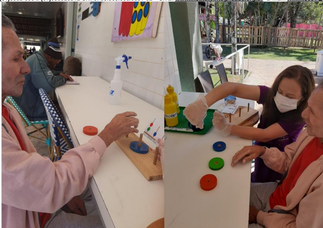
Atendimento individual da terapia ocupacional -junho de 2023

SMPW Trecho 3 Área Especial nº. 01 e 02 – Park Way – Brasília-DF - CEP: 71.735.090 – Fones: (61)3552-0504/ (61)993520912 CNPJ. 00.065.060/0001-92 – SITE: www.institutointegridade.org.br - E-mail: lvmm.sec1@gmail.com