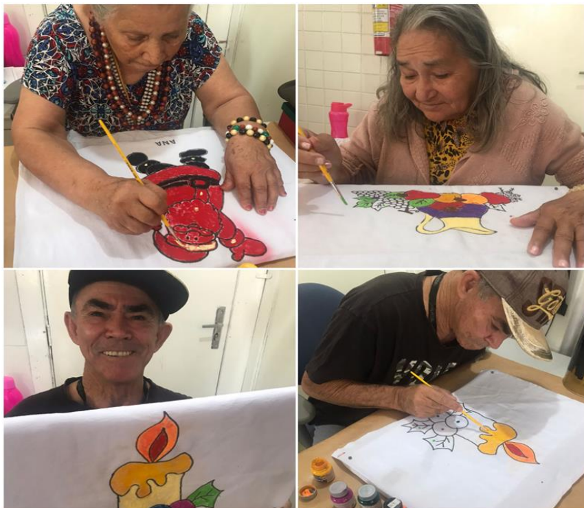
Atividade manual - Pintura no pano de prato - outubro de 2022

SMPW Trecho 3 Área Especial nº. 01 e 02 – Park Way – Brasília-DF - CEP: 71.735.090 – Fones: (61)3552-0504/ (61)993520912 CNPJ. 00.065.060/0001-92 – SITE: www.institutointegridade.org.br - E-mail: lvmm.sec1@gmail.com OUTUBRO /2022