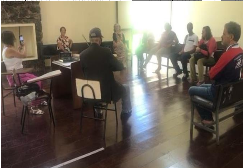
Acompanhamento em atendimento externo - CAPS - Participação da oficina de música.- Março de 2023

SMPW Trecho 3 Área Especial nº. 01 e 02 – Park Way – Brasília-DF - CEP: 71.735.090 – Fones: (61)3552-0504/ (61)993520912 CNPJ. 00.065.060/0001-92 – SITE: www.institutointegridade.org.br - E-mail: lvmm.sec1@gmail.com