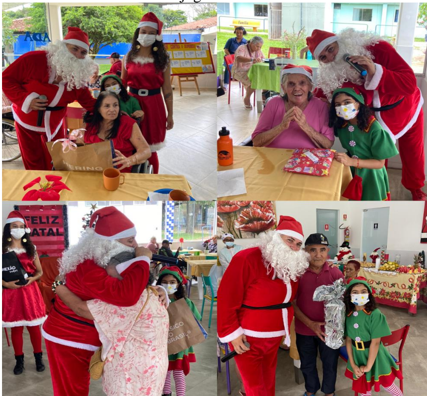
Entrega de presentes - Dezembro de 2022 JANEIRO /2023