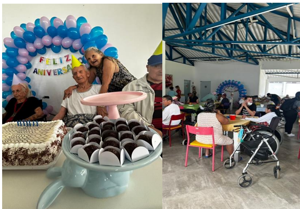
Festa aniversariantes - Abril de 2023