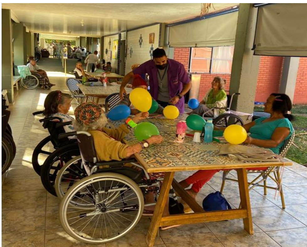
Atividade motora “ não deixe o balão cair” - julho de 2023