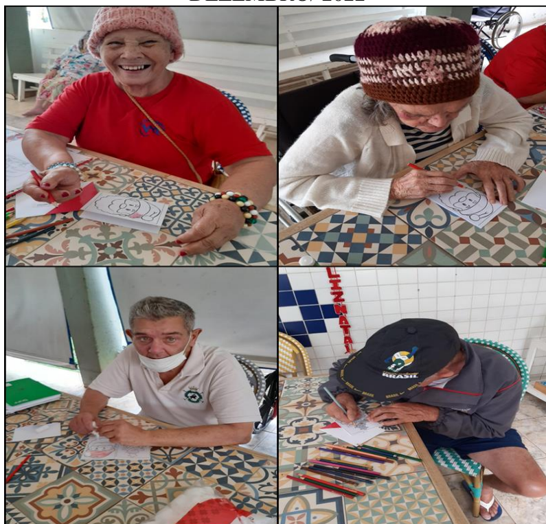
Atividade manual - Dezembro de 2022

SMPW Trecho 3 Área Especial nº. 01 e 02 – Park Way – Brasília-DF - CEP: 71.735.090 – Fones: (61)3552-0504/ (61)993520912 CNPJ. 00.065.060/0001-92 – SITE: www.institutointegridade.org.br - E-mail: lvmm.sec1@gmail.com DEZEMBRO/ 2022