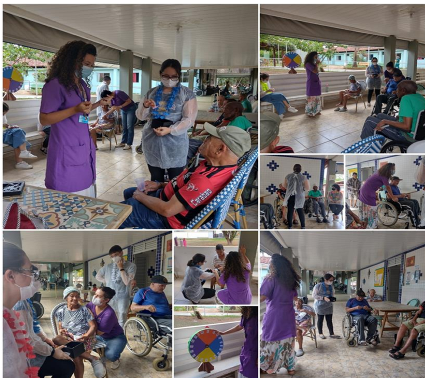
Atividade roleta cognitiva - outubro de 2022