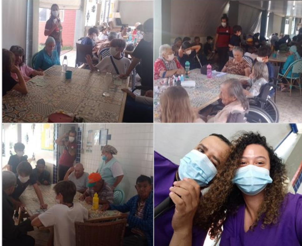
Atividade “ Bingo “ - abril de 2023

SMPW Trecho 3 Área Especial nº. 01 e 02 – Park Way – Brasília-DF - CEP: 71.735.090 – Fones: (61)3552-0504/ (61)993520912 CNPJ. 00.065.060/0001-92 – SITE: www.institutointegridade.org.br - E-mail: lvmm.sec1@gmail.com