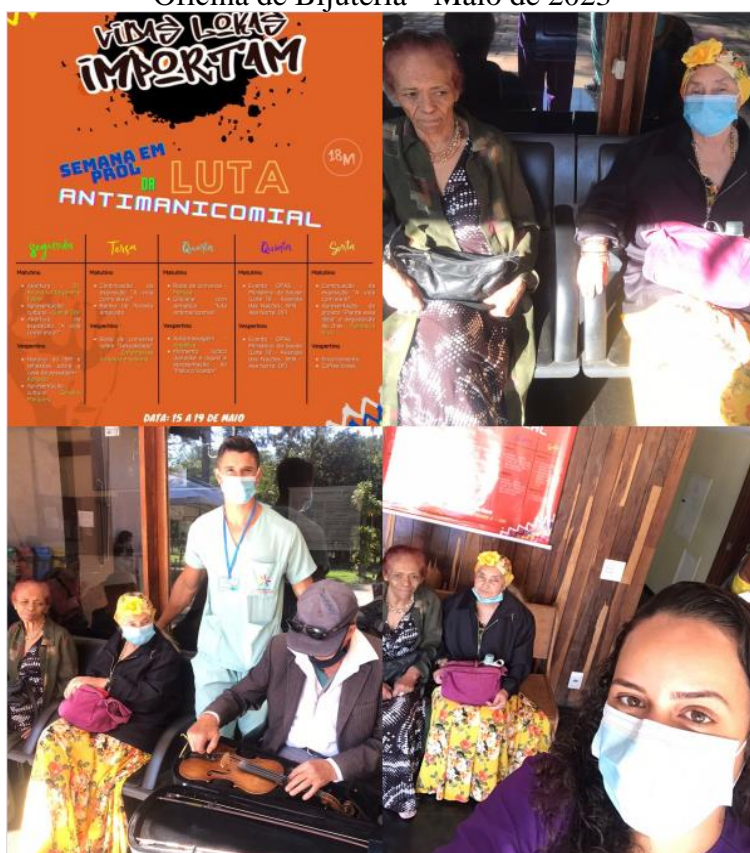
Semana em Prol da Luta Antimanicomial - 15 de maio de 2023