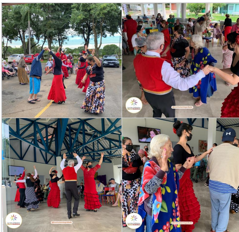
Apresentação Dança espanhola - Fevereiro de 2023

SMPW Trecho 3 Área Especial nº. 01 e 02 – Park Way – Brasília-DF - CEP: 71.735.090 – Fones: (61)3552-0504/ (61)993520912 CNPJ. 00.065.060/0001-92 – SITE: www.institutointegridade.org.br - E-mail: lymm.sec1@gmail.com FEVEREIRO/2023