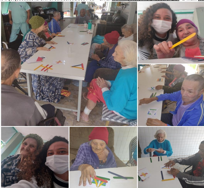
Atendimentos fisioterapia - janeiro de 2023

SMPW Trecho 3 Área Especial nº. 01 e 02 – Park Way – Brasília-DF - CEP: 71.735.090 – Fones: (61)3552-0504/ (61)993520912 CNPJ. 00.065.060/0001-92 – SITE: www.institutointegridade.org.br - E-mail: lvmm.sec1@gmail.com