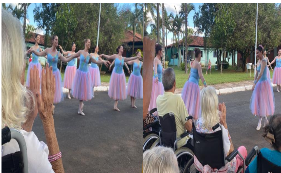
Apresentação de Balé - Maio de 2023

SMPW Trecho 3 Área Especial nº. 01 e 02 – Park Way – Brasília-DF - CEP: 71.735.090 – Fones: (61)3552-0504/ (61)993520912 CNPJ. 00.065.060/0001-92 – SITE: www.institutointegridade.org.br - E-mail: lvmm.sec1@gmail.com MAIO/2023