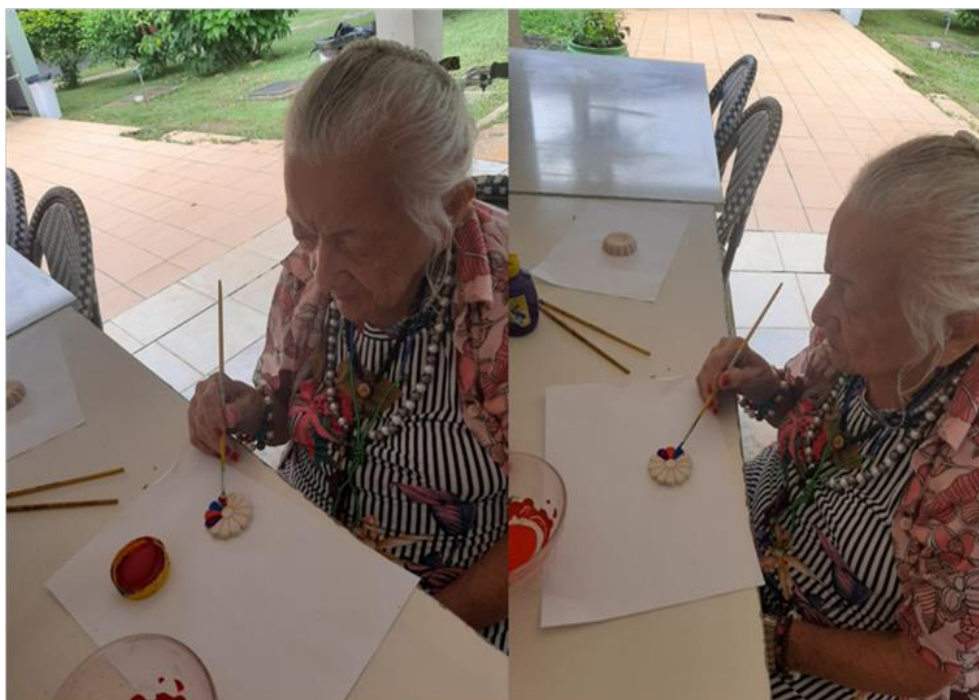
Atividade de Pintura - Abril de 2023