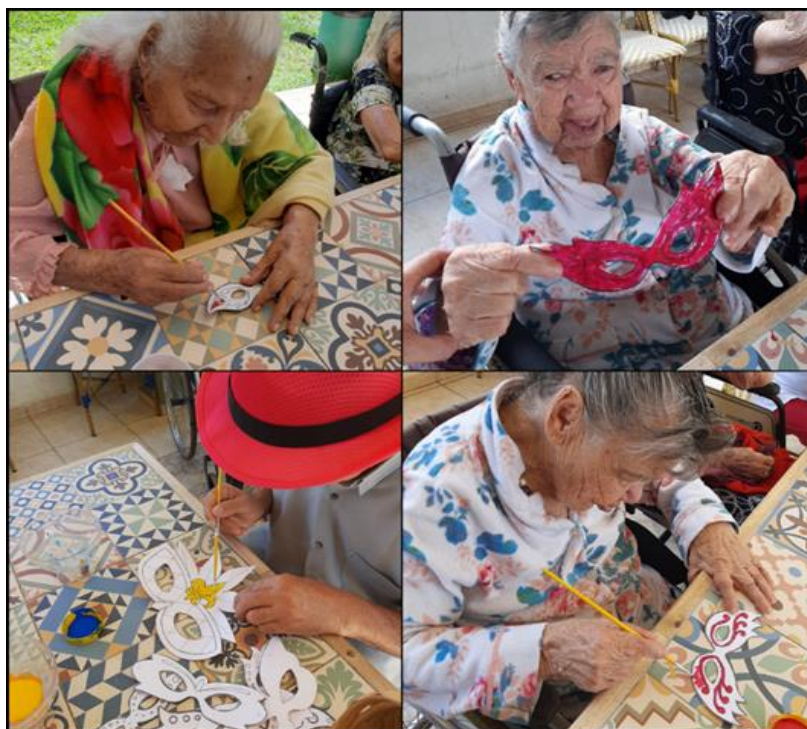
Atividade Temática - Carnaval - Fevereiro de 2023