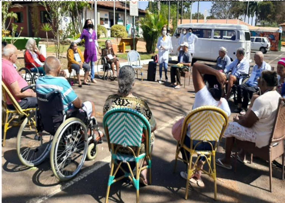
Atividade “ O que você parece pra mim” - Agosto de 2022

SMPW Trecho 3 Área Especial nº. 01 e 02 – Park Way – Brasília-DF - CEP: 71.735.090 – Fones: (61)3552-0504/ (61)993520912 CNPJ. 00.065.060/0001-92 – SITE: www.institutointegridade.org.br - E-mail: lvmm.sec1@gmail.com