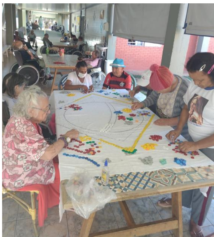
Atividade Manual - agosto de 2023