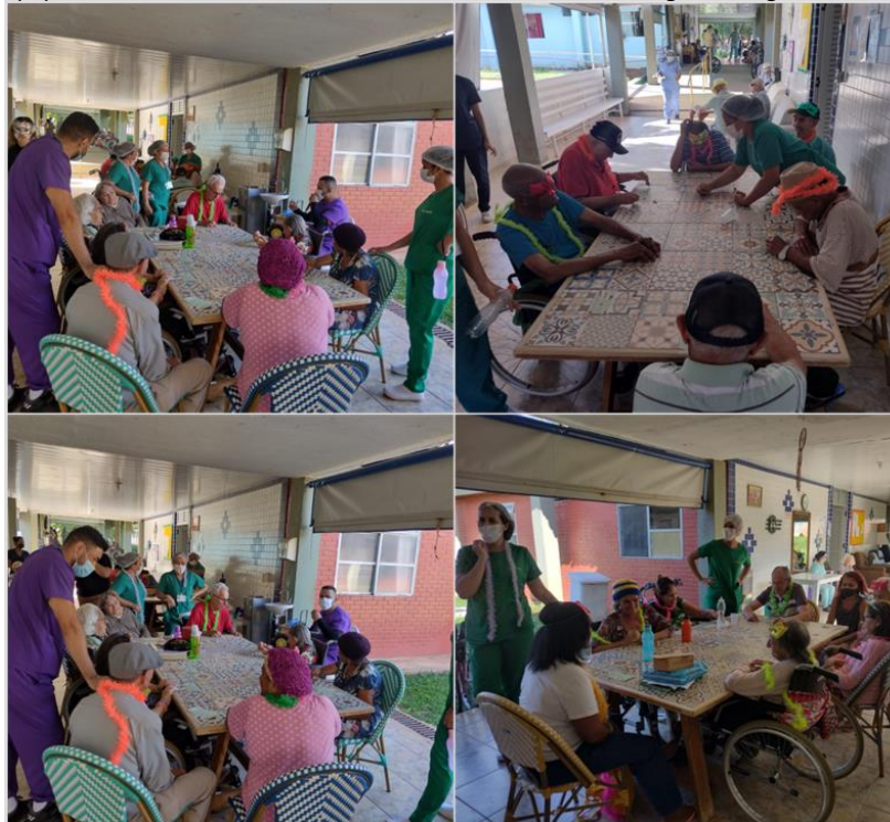
Atividade “ Bingo” - Fevereiro de 2023

SMPW Trecho 3 Área Especial nº. 01 e 02 – Park Way – Brasília-DF - CEP: 71.735.090 – Fones: (61)3552-0504/ (61)993520912 CNPJ. 00.065.060/0001-92 – SITE: www.institutointegridade.org.br - E-mail: lvmm.sec1@gmail.com