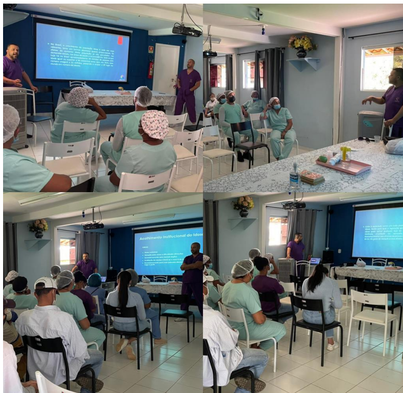
Palestra com os colaboradores - janeiro de 2023