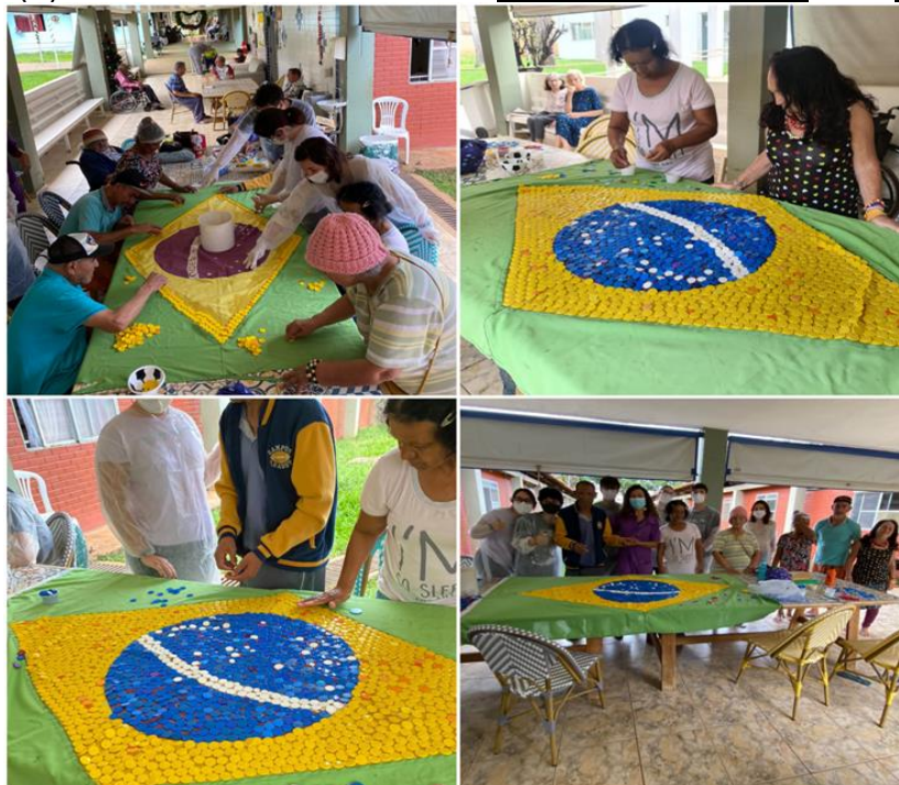
Atividade temática - copa do mundo - novembro de 2022

SMPW Trecho 3 Área Especial nº. 01 e 02 – Park Way – Brasília-DF - CEP: 71.735.090 – Fones: (61)3552-0504/ (61)993520912 CNPJ. 00.065.060/0001-92 – SITE: www.institutointegridade.org.br - E-mail: lvmm.sec1@gmail.com