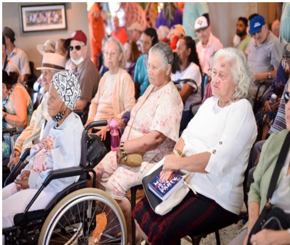
Evento Páscoa – Pontão do Lago Sul - Abril de 2023

SMPW Trecho 3 Área Especial nº. 01 e 02 – Park Way – Brasília-DF - CEP: 71.735.090 – Fones: (61)3552-0504/ (61)993520912 CNPJ. 00.065.060/0001-92 – SITE: www.institutointegridade.org.br - E-mail: lvmm.sec1@gmail.com ABRIL/2023