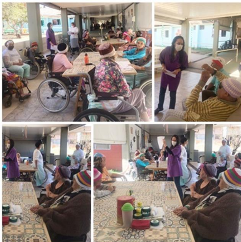
Quiz - Agosto de 2022