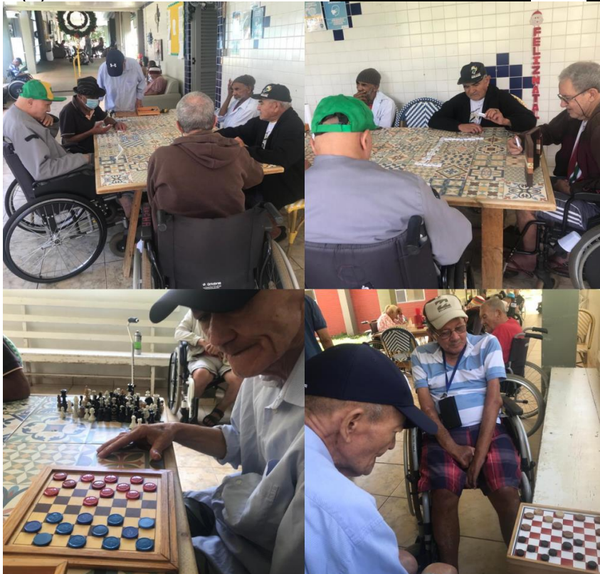
Atividade com jogos - Dezembro de 2022

SMPW Trecho 3 Área Especial nº. 01 e 02 – Park Way – Brasília-DF – CEP: 71.735.090 – Fones: (61)3552-0504/ (61)993520912 CNPJ. 00.065.060/0001-92 – SITE: www.institutointegridade.org.br - E-mail: lvmm.sec1@gmail.com