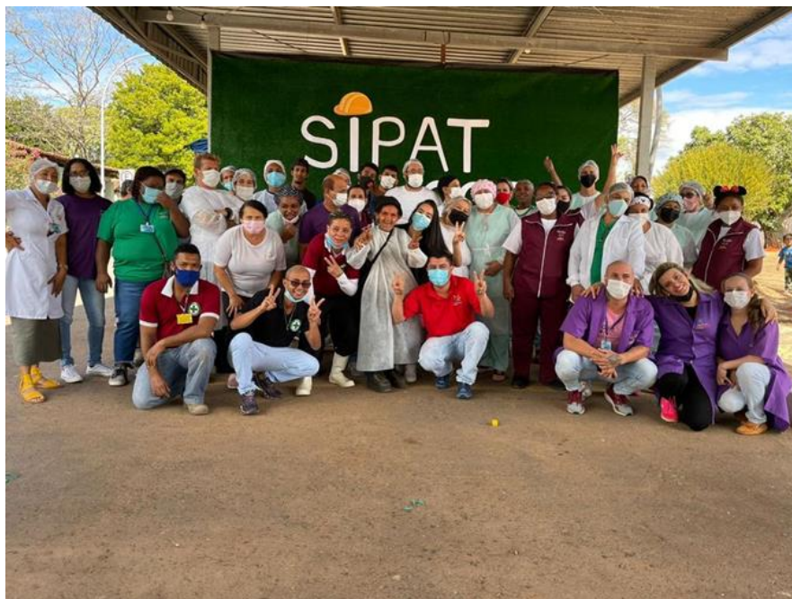
Evento CIPA 16,18 e 19 de agosto de 2022