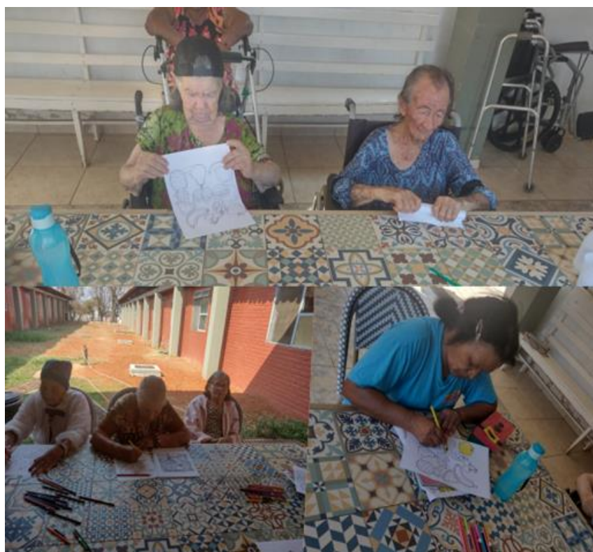
Atividade de pintura - setembro de 2023