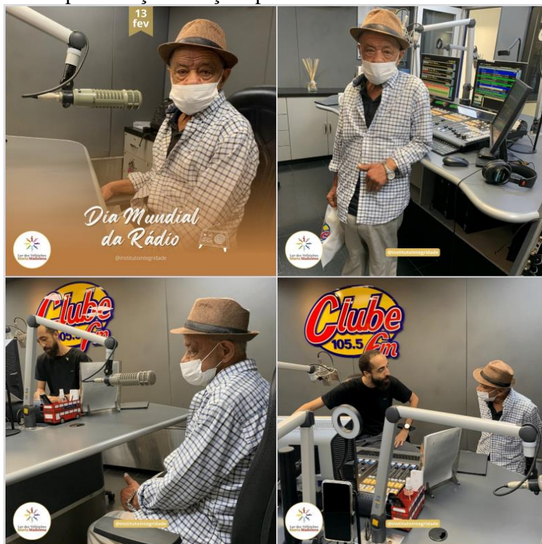
Atividade externa - Fevereiro de 2023