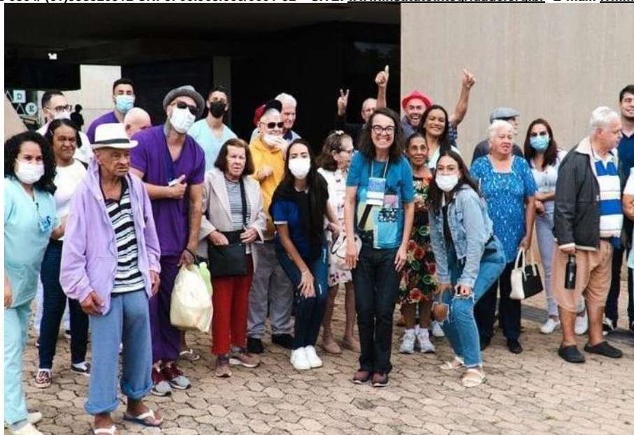
Atividade Externa - Passeio ao Centro Cultural Banco do Brasil “ IV Festival Internacional de Cinema Fantástico” Filme : Capitão Astúcia - Março de 2023

SMPW Trecho 3 Área Especial nº. 01 e 02 – Park Way – Brasília-DF - CEP: 71.735.090 – Fones: (61)3552-0504/ (61)993520912 CNPJ. 00.065.060/0001-92 – SITE: www.institutointegridade.org.br - E-mail: lvmm.sec1@gmail.com