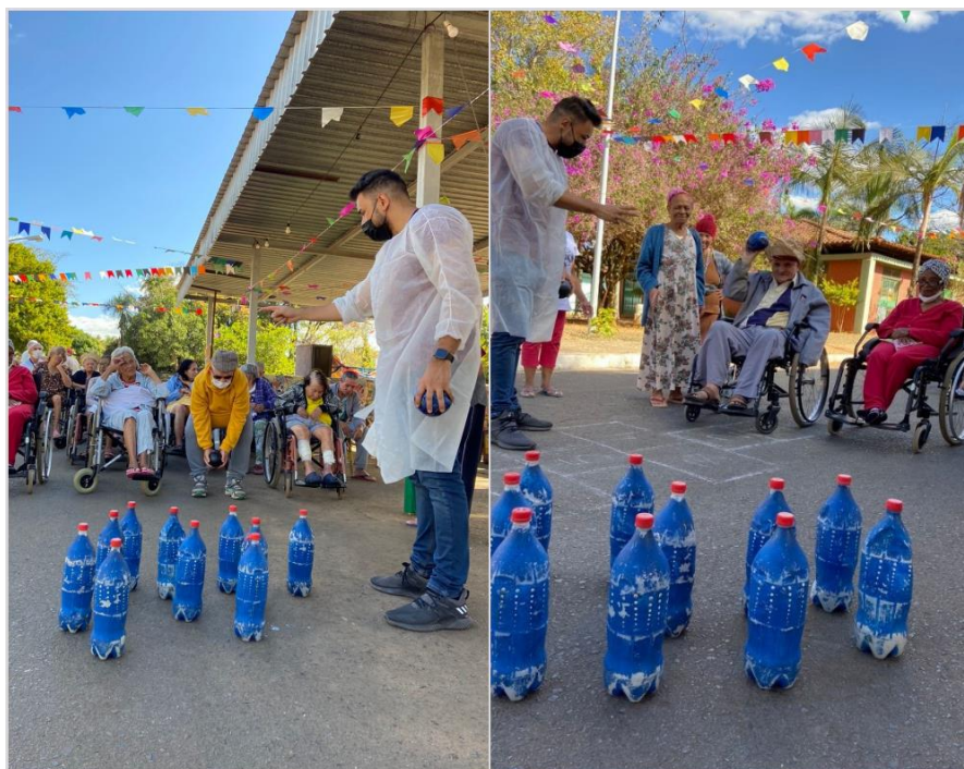
Atividade “ Boliche” - Julho de 2022