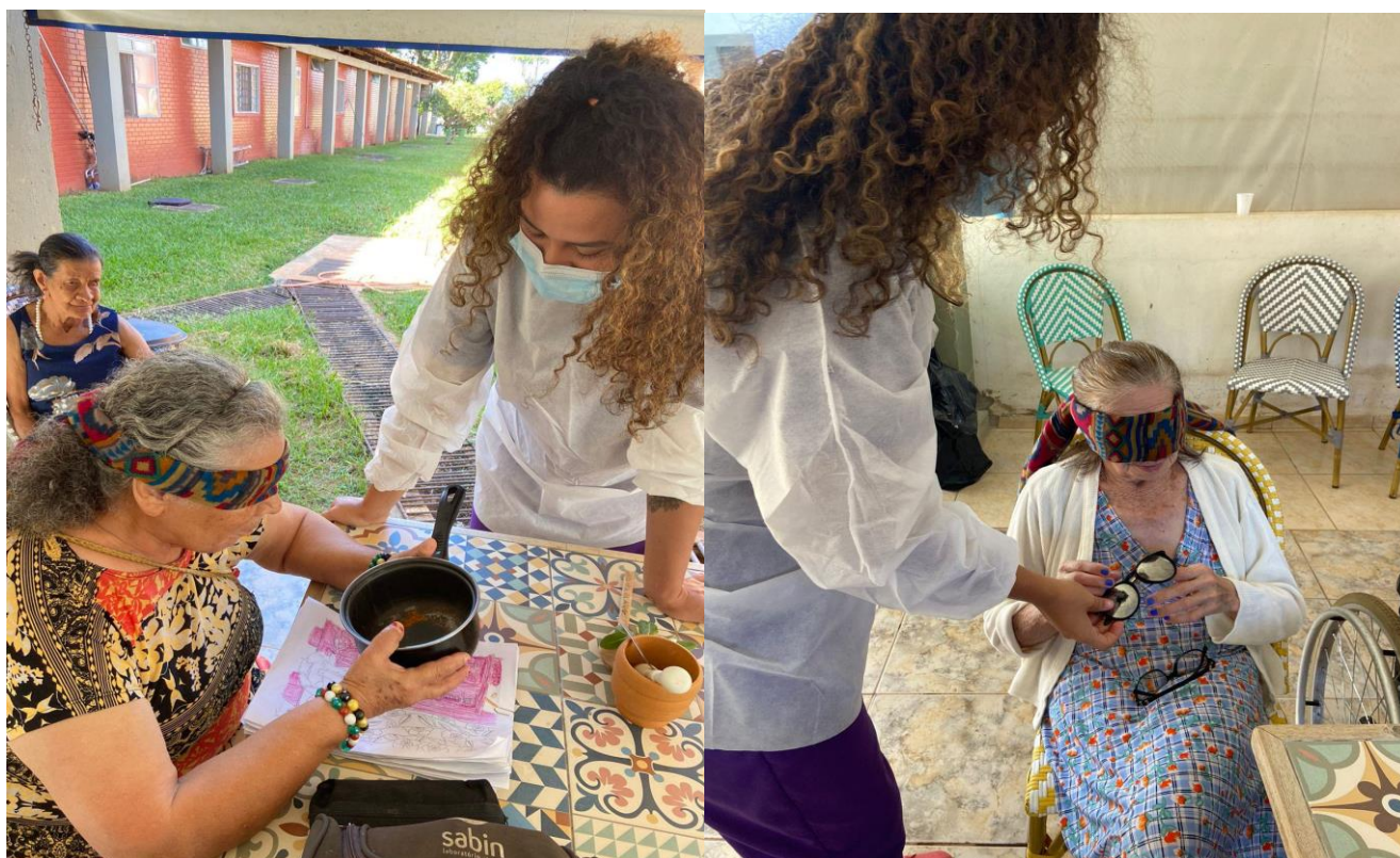
Atividade Sensorial - Março de 2023