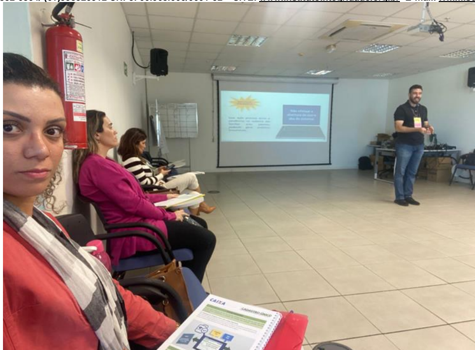
Curso “cadastro Único” 12 e 13 de junho de 2023

SMPW Trecho 3 Área Especial nº. 01 e 02 – Park Way – Brasília-DF - CEP: 71.735.090 – Fones: (61)3552-0504/ (61)993520912 CNPJ. 00.065.060/0001-92 – SITE: www.institutointegridade.org.br - E-mail: lvmm.sec1@gmail.com