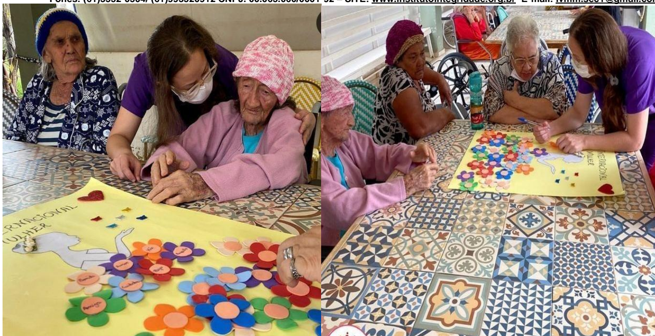
Atividade manual Temática - Dia internacional da Mulher - Março de 2023

SMPW Trecho 3 Área Especial nº. 01 e 02 – Park Way – Brasília-DF - CEP: 71.735.090 – Fones: (61)3552-0504/ (61)993520912 CNPJ. 00.065.060/0001-92 – SITE: www.institutointegridade.org.br - E-mail: lvmm.sec1@gmail.com