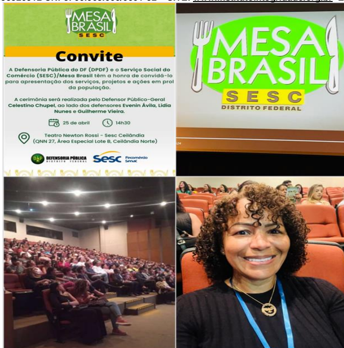
Apresentação dos Serviços Projetos e Ações em prol da população - Abril de 2023

SMPW Trecho 3 Área Especial nº. 01 e 02 – Park Way – Brasília-DF - CEP: 71.735.090 – Fones: (61)3552-0504/ (61)993520912 CNPJ. 00.065.060/0001-92 – SITE: www.institutointegridade.org.br - E-mail: lvmm.sec1@gmail.com