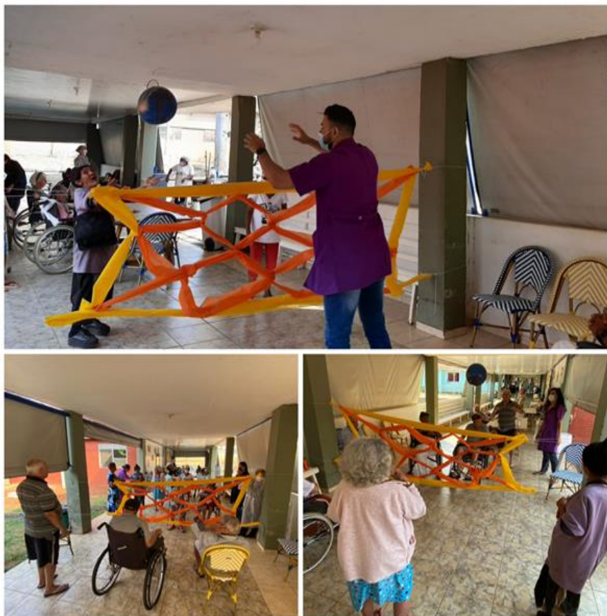
Atividade motora “ Vôlei “ - setembro de 2022

SMPW Trecho 3 Área Especial nº. 01 e 02 – Park Way – Brasília-DF - CEP: 71.735.090 – Fones: (61)3552-0504/ (61)993520912 CNPJ. 00.065.060/0001-92 – SITE: www.institutointegridade.org.br - E-mail: lvmm.sec1@gmail.com