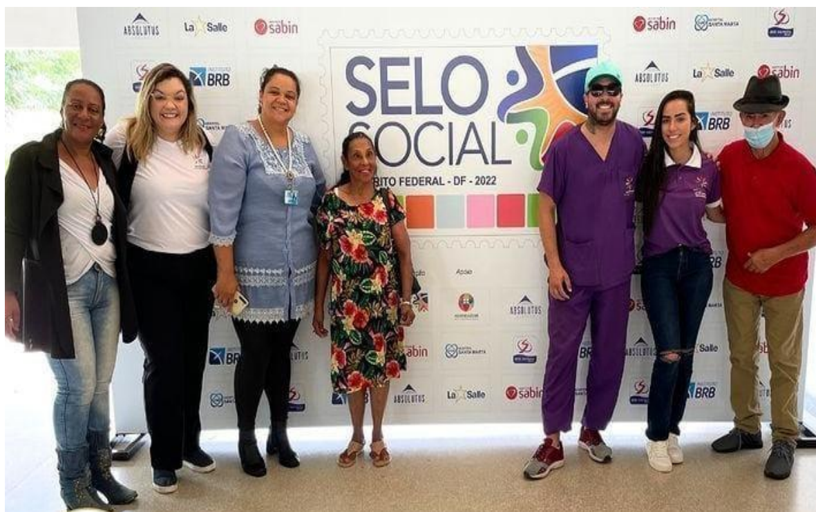
Recebendo certificado de Selo Social - Março de 2023