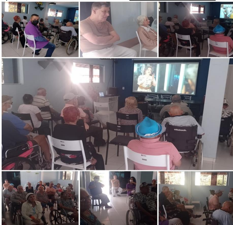
Cinemateca - agosto de 2022

SMPW Trecho 3 Área Especial nº. 01 e 02 – Park Way – Brasília-DF - CEP: 71.735.090 – Fones: (61)3552-0504/ (61)993520912 CNPJ. 00.065.060/0001-92 – SITE: www.institutointegridade.org.br - E-mail: lvmm.sec1@gmail.com