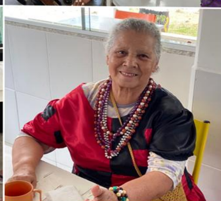
Festa de halloween - Outubro de 2022