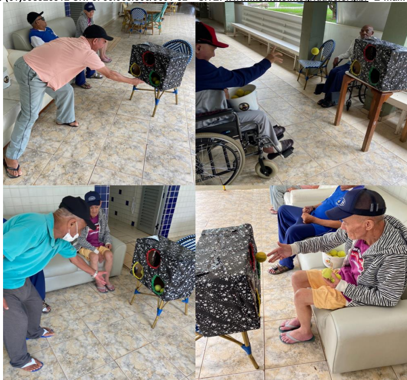
Atividade motora “bola na caixa” - janeiro de 2023

SMPW Trecho 3 Área Especial nº. 01 e 02 – Park Way – Brasília-DF - CEP: 71.735.090 – Fones: (61)3552-0504/ (61)993520912 CNPJ. 00.065.060/0001-92 – SITE: www.institutointegridade.org.br - E-mail: lvmm.sec1@gmail.com