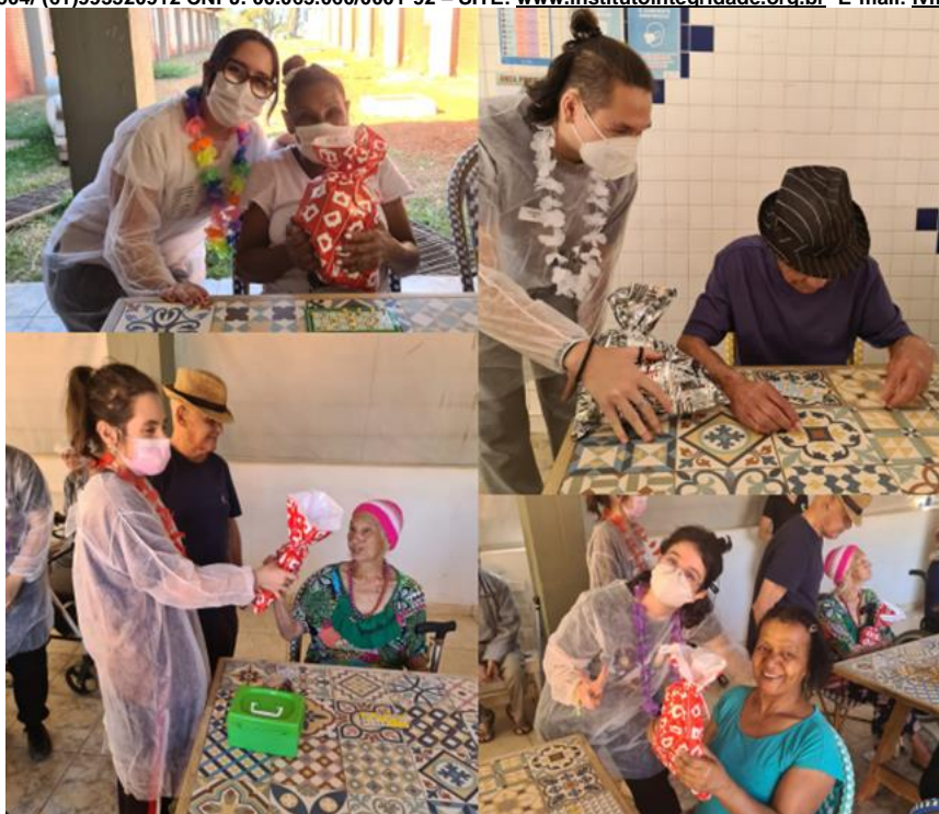
Atividade “ Bingo” - setembro de 2023

SMPW Trecho 3 Área Especial nº. 01 e 02 – Park Way – Brasília-DF - CEP: 71.735.090 – Fones: (61)3552-0504/ (61)993520912 CNPJ. 00.065.060/0001-92 – SITE: www.institutointegridade.org.br - E-mail: lvmm.sec1@gmail.com