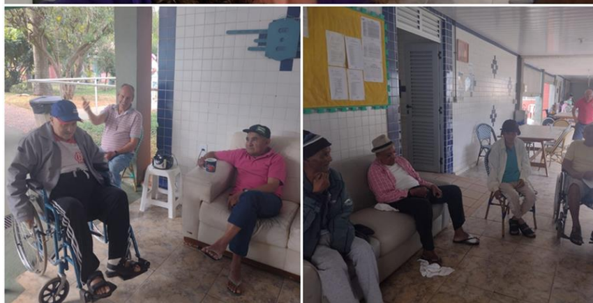
Roda de conversa temática “músicas e gerações - junho de 2023