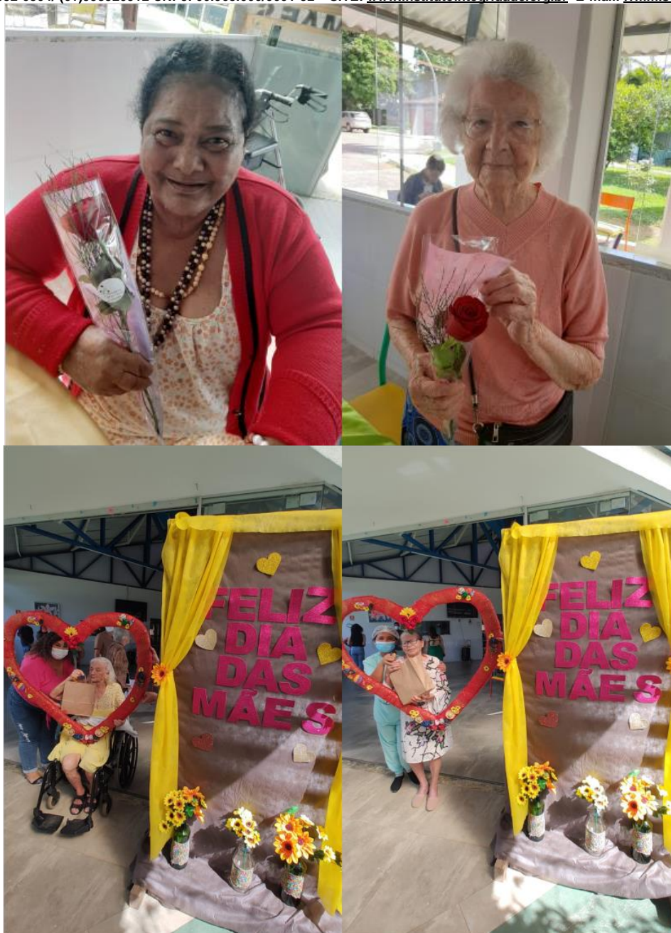
Almoço do dia das mães - Maio de 2023

SMPW Trecho 3 Área Especial nº. 01 e 02 – Park Way – Brasília-DF - CEP: 71.735.090 – Fones: (61)3552-0504/ (61)993520912 CNPJ. 00.065.060/0001-92 – SITE: www.institutointegridade.org.br E-mail: lvmm.sec1@gmail.com