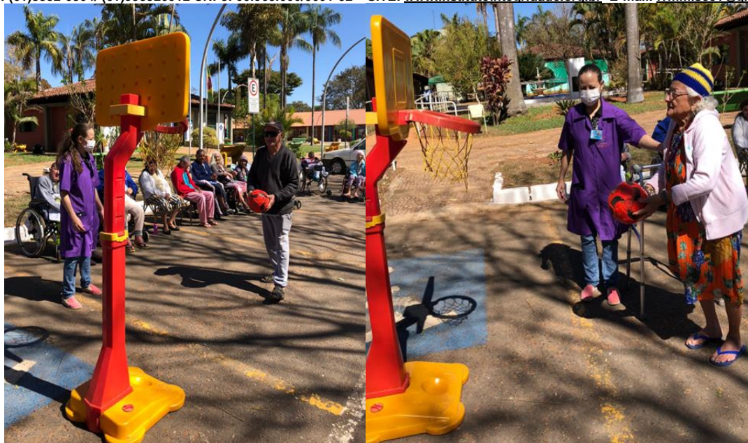
Atividade Basquete - agosto de 2022

SMPW Trecho 3 Área Especial nº. 01 e 02 – Park Way – Brasília-DF – CEP: 71.735.090 – Fones: (61)3552-0504/ (61)993520912 CNPJ. 00.065.060/0001-92 – SITE: www.institutointegridade.org.br - E-mail: lvmm.sec1@gmail.com