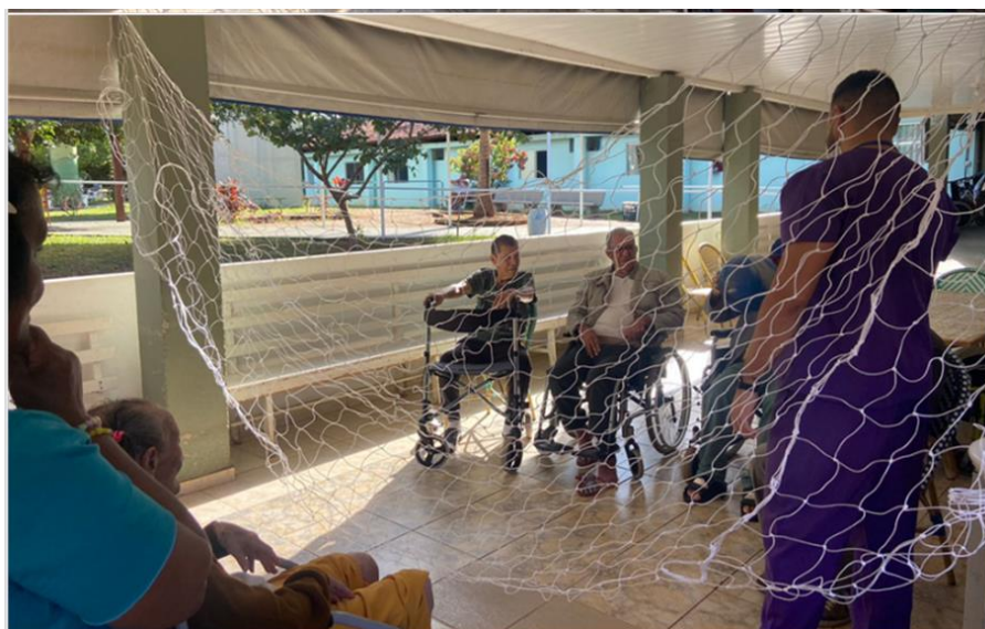
Atividade “vôlei adaptado - junho de 2023