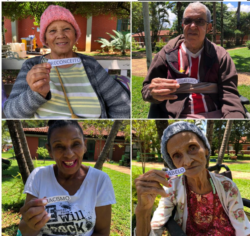
Atividade temática “Consciência Negra” - 17 de novembro de 2022

SMPW Trecho 3 Área Especial nº. 01 e 02 – Park Way – Brasília-DF – CEP: 71.735.090 – Fones: (61)3552-0504/ (61)993520912 CNPJ. 00.065.060/0001-92 – SITE: www.institutointegridade.org.br - E-mail: lvmm.sec1@gmail.com