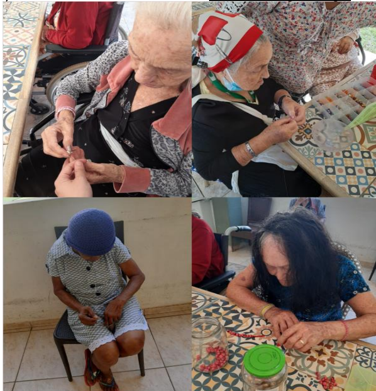
Oficina de Bijuteria - Maio de 2023

SMPW Trecho 3 Área Especial nº. 01 e 02 – Park Way – Brasília-DF - CEP: 71.735.090 – Fones: (61)3552-0504/ (61)993520912 CNPJ. 00.065.060/0001-92 – SITE: www.institutointegridade.org.br - E-mail: lvmm.sec1@gmail.com