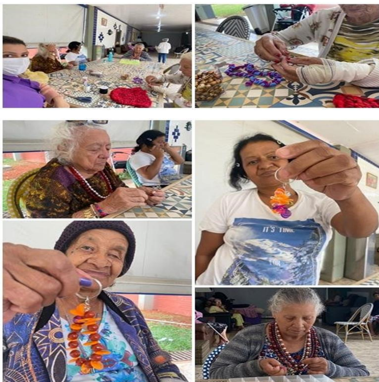
Atividade “ oficina de bijuteria “ - novembro de 2022