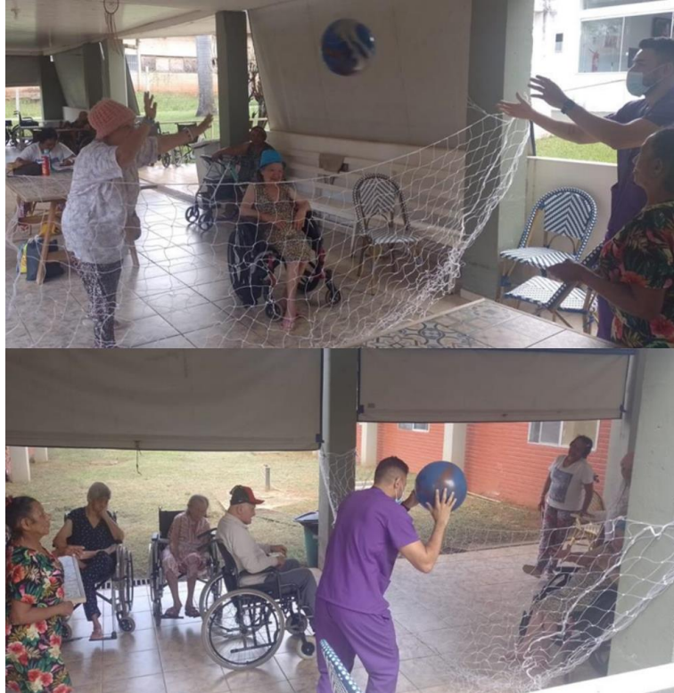
Atividade “vôlei da terceira idade” - janeiro de 2023

SMPW Trecho 3 Área Especial nº. 01 e 02 – Park Way – Brasília-DF - CEP: 71.735.090 – Fones: (61)3552-0504/ (61)993520912 CNPJ. 00.065.060/0001-92 – SITE: www.institutointegridade.org.br - E-mail: lymm.sec1@gmail.com