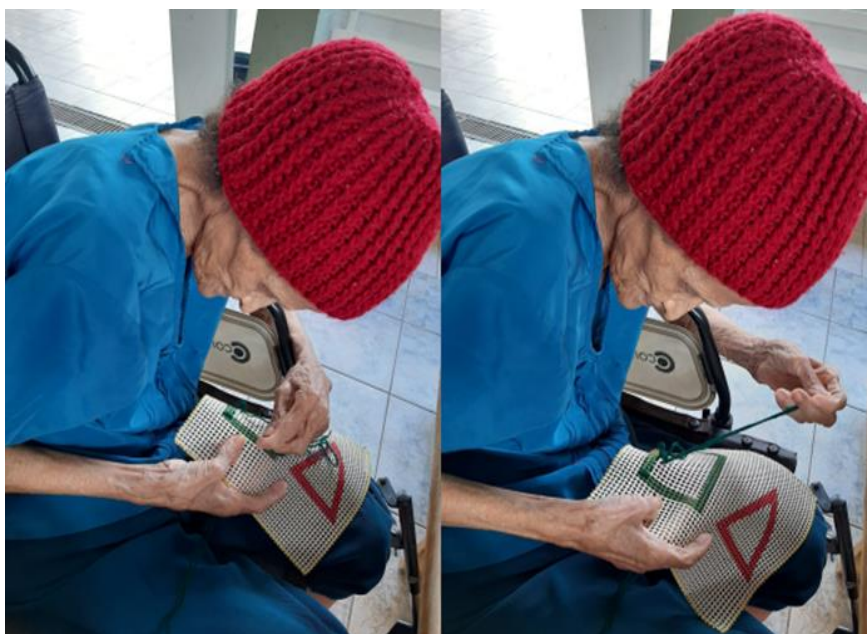
Atividade manual - janeiro de 2023