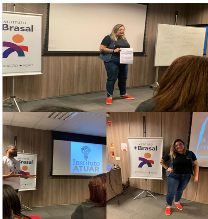
Workshop Elaboração de projetos e Captação de recursos - promovido pelo Instituto Brasal - Abril de 2023