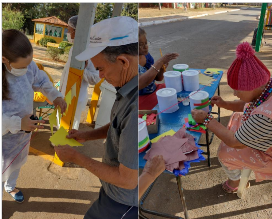
“Oficina de jogos juninos” – Julho de 2022