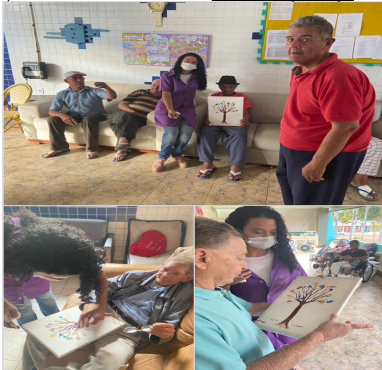
Atividade temática - Dia dos Pais - agosto de 2023

SMPW Trecho 3 Área Especial nº. 01 e 02 – Park Way – Brasília-DF - CEP: 71.735.090 – Fones: (61)3552-0504/ (61)993520912 CNPJ. 00.065.060/0001-92 – SITE: www.institutointegridade.org.br - E-mail: lvmm.sec1@gmail.com