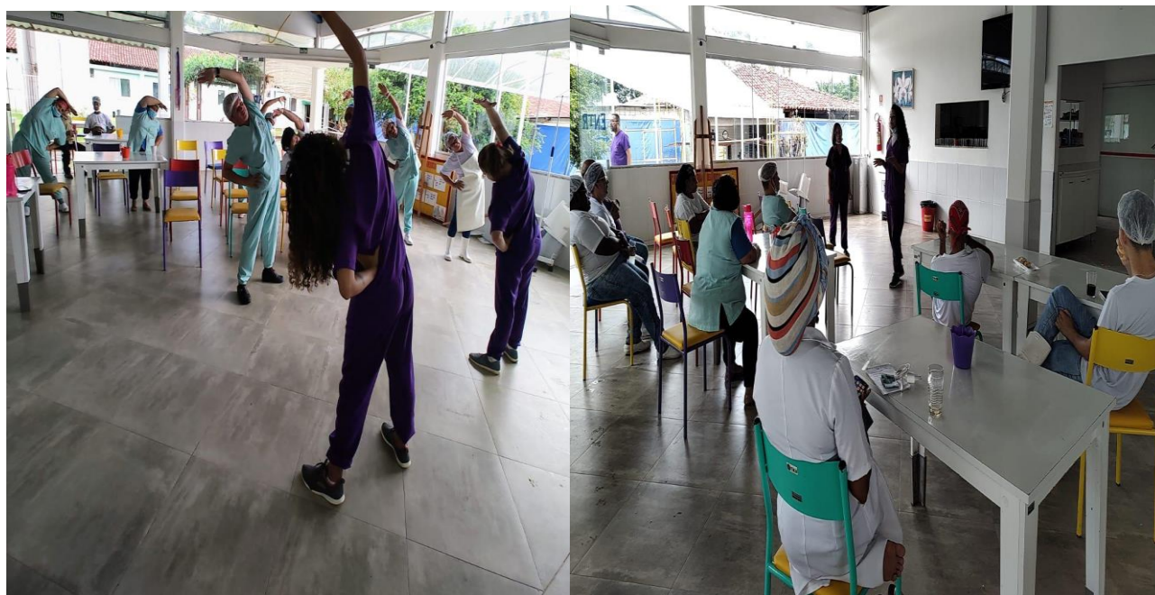
Bate papo com os colaboradores - tema: Alzheimer e Lesão por esforço repetitivo - Março de 2023

SMPW Trecho 3 Área Especial nº. 01 e 02 – Park Way – Brasília-DF - CEP: 71.735.090 – Fones: (61)3552-0504/ (61)993520912 CNPJ. 00.065.060/0001-92 – SITE: www.institutointegridade.org.br - E-mail: lymm.sec1@gmail.com